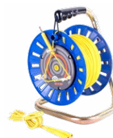
Cable en carrete amarillo 75 m / 100 m / 200 m

WAPRZ075BUBBSZ WAPRZ100BUBBSZ WAPRZ200BUBBSZ