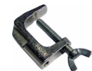
Mordaza (conec- tor tipo banana)