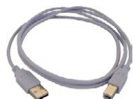
Cable de transmi- sión, terminado con conector USB