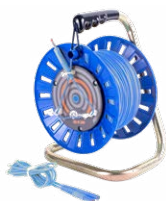
Cable en carre- te azul 75 m / 100 m / 200 m

WAPRZ075REBBSZ WAPRZ100REBBSZ WAPRZ200REBBSZ