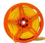
Cable 50 m en carre- te (conectores tipo banana) amarillo