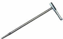
2x sonda de medi- ción para clavar en el suelo (30 cm)