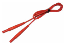
Cable 1,2 m rojo 1 kV (conectores tipo banana)