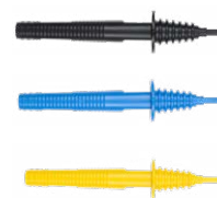
Sonda de punta 1 kV (toma tipo banana) negra / azul / amarilla