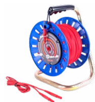
Cable en carre- te rojo 75 m / 100 m / 200 m

WAPRZ075REBBSZ WAPRZ100REBBSZ WAPRZ200REBBSZ