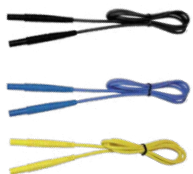
Cable 1,2 m (conec- tores tipo banana) rojo / azul / amarillo