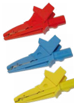
Cocodrilo 1 kV 20 A rojo / azul / amarillo

WAPRZ040YEBBSZ WAPRZ060YEBBSZ WAPRZ080YEBBSZ