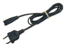
Cable de alimenta- ción 230 V (co- nector IEC C7)